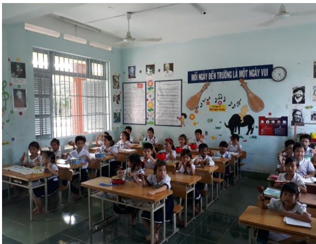
Hình ảnh học sinh sử dụng nhiều bộ gõ trong một tiết học