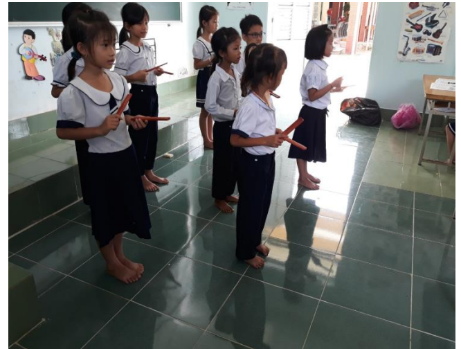
Hình ảnh HS sử dụng Thanh phách