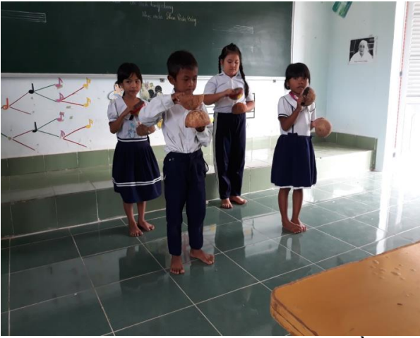
Hình ảnh HS sử dụng bộ gõ bằng vỏ dừa loan