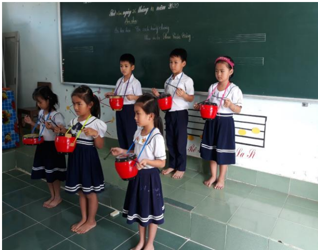
Hình ảnh HS sử dụng nhạc cụ Trống con