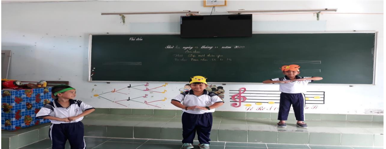
Ban nhạc Đô – Rê – Mi của bọn tớ nhé

Ví dụ: Gv cho một bạn C đóng vai Mi sẽ làm ký hiệu Mi giống như hình bên và cũng với hình tương tự như bạn Đô và Rê vừa đội lên đầu chiếc mũ gắn hình ký hiệu Mi vừa làm động tác tay để thể hiện đó là nốt mi