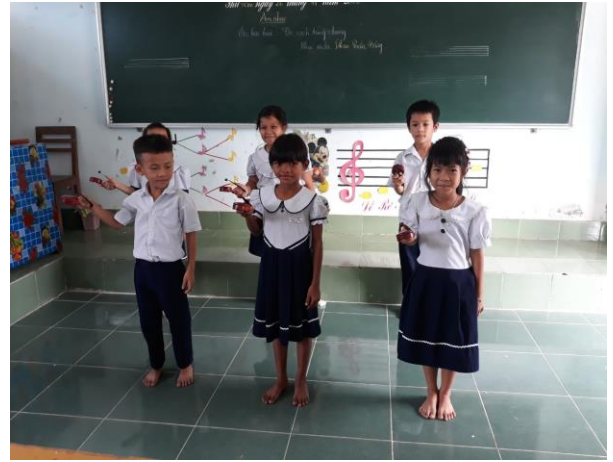
Hình ảnh HS sử dụng bộ gõ Song